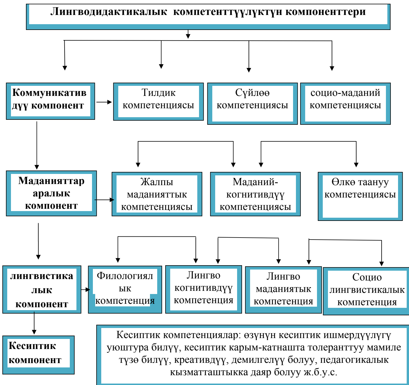
1-сүрөт Лингводидактикалык компетенттүүлүктүн компоненттери

Лингводидактикалык компетенттүүлүктүн мааниси өзгөчө статуска ээ, ал атайын кесиптик маанидеги компетенциялардын системасын өзүнүн түзүлүшүндө интеграциялайт. Алардын айрымдарын атап кетсек: өзүнүн кесиптик ишмердүүлүгүн уюштура билүү, өзүнүн өсүп өнүгүү деңгээлинин жеке жетишкендиктерин жетектөө, мугалим катары көп сапаттарга ээ болуу креативдүү, демилгелүү болуу, окуучусуна карата педагогикалык кызматташтыкка даяр болуу жана башка ушул сыяктуу кесиптик компетенциялардын калыптанышына өбөлгө түзөөрү талашсыз.